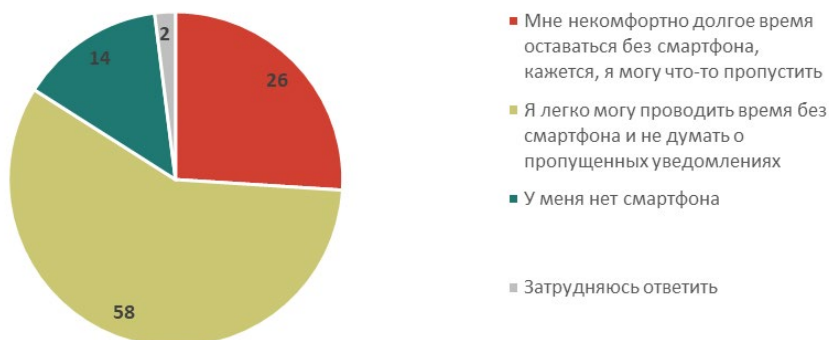
Рис. 2. Современные телефоны — их называют смартфонами — помимо выполнения обычных звонков, позволяют входить в интернет, устанавливать дополнительные приложения, смотреть видео, общаться в социальных сетях, совершать онлайн-покупки. Многие из нас постоянно получают на смартфон уведомления о новостях, звонках, новых сообщениях. Какое из перечисленных утверждений лучше подходит Вам: ... (закрытый вопрос, один ответ, в % от всех опрошенных)

Скорее «женскими» занятиями в смартфоне можно назвать общение (67% vs. 55% мужчин), онлайн-покупки (39% vs. 22%) и просмотр соцсетей (35% vs. 29%), тогда как чтение новостей — скорее «мужским» (42% vs. 37% среди женщин).