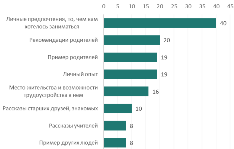
Рис. 2. Давайте поговорим на тему профподготовки или профориентации (это помощь в выборе подходящей профессии, которая соответствует интересам и возможностям человека). На Ваш взгляд, кто или что в большей степени оказал влияние на Ваш выбор профессии? Вы можете дать до четырех ответов (закрытый вопрос, до 4-х ответов, % от всех опрошенных; на рисунок выведены варианты, набравшие более 5% поддержки)

считают целесообразным в общей сложности 16%, этот взгляд ближе россиянам старше 60 лет (28%). Только 5% россиян полагают, что профориентационную работу проводить в школах и детских садах не нужно вовсе.