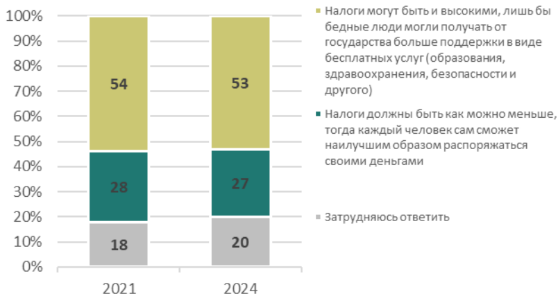
Рис. 1. Скажите, пожалуйста, какое суждение точнее всего отражает Ваше мнение? (закрытый вопрос, один ответ, % от всех опрошенных)

ной аудитории). Они же чаще говорят, что налоги могут быть и высокими, лишь бы бедные люди могли получать от государства больше поддержки в виде бесплатных услуг — 59% (vs. 53% среди всех россиян и 49% в низкодоходной аудитории).